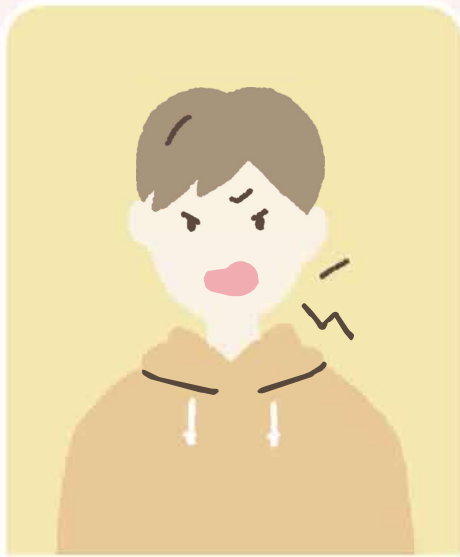
怒りやすくなった